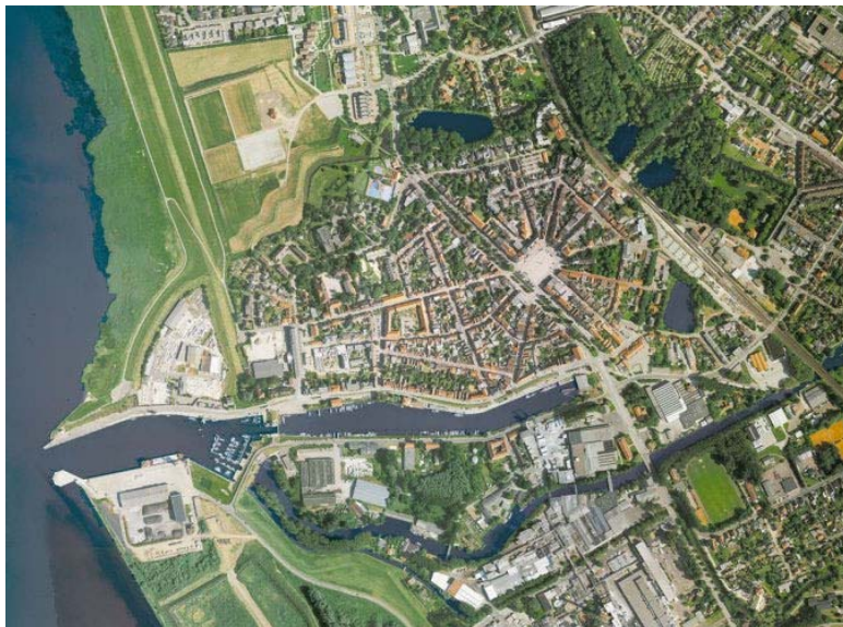
Luftbild des historischen Kerns (zwanzigstes Jahrhundert)

der Welt erblicken. Künste, Wissenschaften und technologische Erfindungen bzw. Erzeugnisse werden zu geglücktem Spielmaterial in nachhaltigen Kombinationen der Realität. Deren Produktionsorte sind nun nicht mehr nur industriell geprägt, sondern können überall und grenzenlos, auch im virtuellen Raum erzeugt werden. – „Real-Orte“ aber, Plätze, auf denen sich die Menschen tatsächlich versammeln, werden zu Konstitutionsorten von Weltbürgerlichkeit, wenn das Archivstudium, der Bibliotheksbesuch oder die hybride Facebook-Seite zur bewussten Begegnung führt.