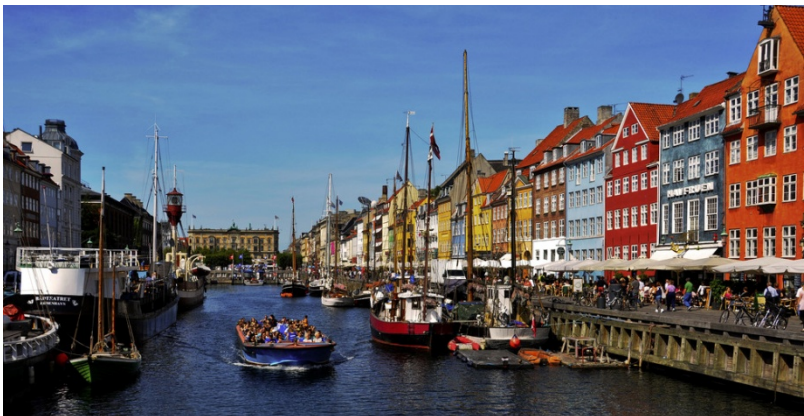
Nyhaven in Kopenhagen

Eine heute realisierte Stadt- und Staatsverfassung, und nichts anderes hatte Christian für seine Zeit im Sinn, legt die historisch überkommene „Souveränität“ unserer tragischen Könige und Helden in die Hände der Vielen, in die Hände derer, die erfahren, dass sie sich zukünftig ertragen können, und dies in netzvermittelter Gleichzeitigkeit und virtuell ergänztem Raum. Der Sinn der Politik, die Sinnstiftung von sich aufeinander beziehenden „Einzelmenschen“ ist persönliche Freiheit, politische Freiheit aber bindet uns alle gleichermaßen. Die Erfahrung der „Könige“ von Renaissance und Industrie, ihren Freiheitswillen können wir nur annehmen, wenn wir neubeginnen , uns sozusagen als Konstituante des globalen „Souveräns“ begreifen. Sie haben dazu beigetragen, dass „die große Menschheit“ denkbar wurde.