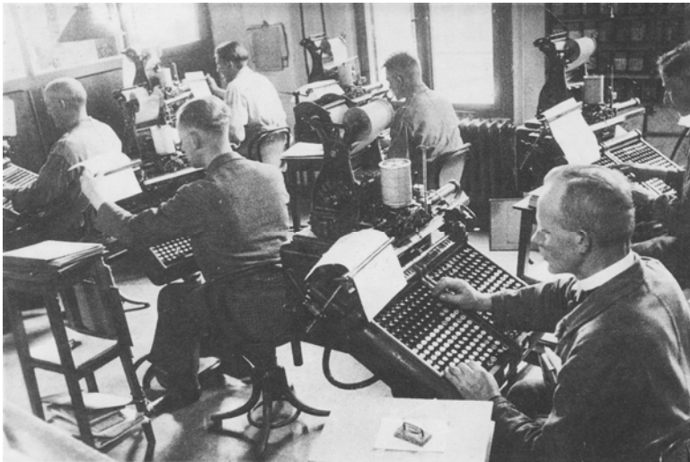
Glückstadt: Texterfassung durch Monotype-Taster (um 1928)

überdimensionierten und doch wohlgeordneten Setzkästen, die als Magazin und Arbeitsort der