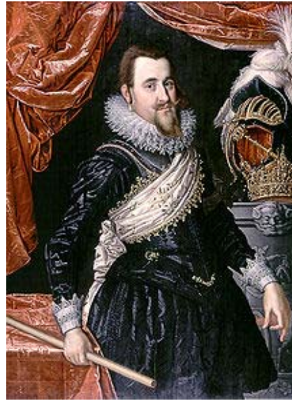
Christian IV. 1625.in Siegerpose Pieter Isaacsz (1569 - 1625)