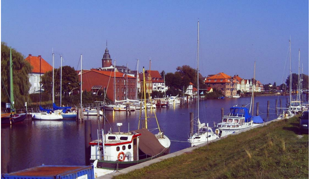
Rhinhafen (Binnenhafen) in Glückstadt