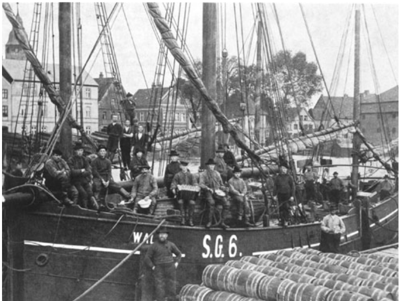
Heringsfischer (zwanzigstes Jahrhundert)