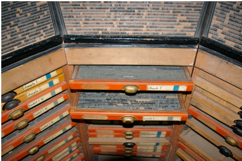
Der chinesische Zirkel (um 1926)

Leistung, von Heinrich Wilhelm Augustin von Anfang an geradezu programmatisch beabsichtigt war, prägte auch die spätere Vielfalt virtueller Programme. Der universelle Anspruch der glückstädter Technologie der 20iger Jahre wiederholt sich in den 90iger Jahren im Schritt von „ASCII-Code“ zum „Unicode Consortium“. Deren Datensätze wurden von den umfangreichen begehbaren Rund-Setzkästen der 20iger Jahre im Stammhaus der Augustins präfiguriert und leisten virtuell jetzt das, was bereits die Auftraggeber des analogen Druck verlangten: Sprachen und Phoneme der Welt, menschliche Stimmen in sich revolutionierenden Medien zeichenhaft zu fixieren und sprachklanglich reproduzierbar zu machen: also, die „Laute“ und die „Musik“ der Weltkommunikation zu objektivieren und damit jederzeit reproduzierbar zu machen.