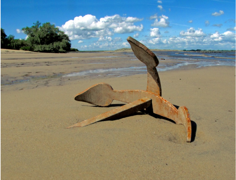
Die versandete Elbe vor Glückstadt