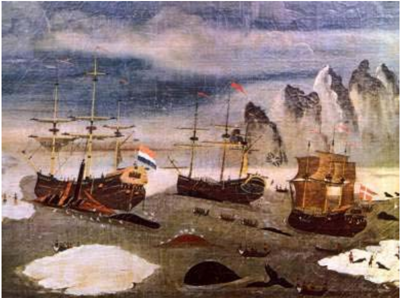
Dänisches und niederländisches Walfang-Schiff vor Spitzbergen (siebzehntes Jahrhundert)

Wie aber entwickeln sich in all den Jahren nach 1648 die wirklichen Unternehmungen Glückstadts? Sicherlich, auch hier, im Schatten Hamburgs, finden die Menschen ihr Auskommen in der Erwerbswirtschaft: