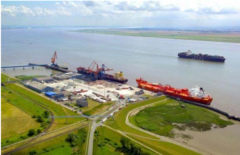
Untereibeufer als Orte der Ansiedlung (bei Brunshüttelkoog)

Und so sollten wir zunächst an unserem Traumort „Neu-Kopenhagen“ ankommen, wie gerettete Migrant*innen und Pioniere. Alle Sinne öffnend, so als würden uns Heutigen die dänischen Versprechungen von 1617 noch einmal gemacht.